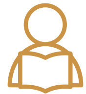
Ansiedad estado vs inserción social en estudiantes de medicina de la UNISA