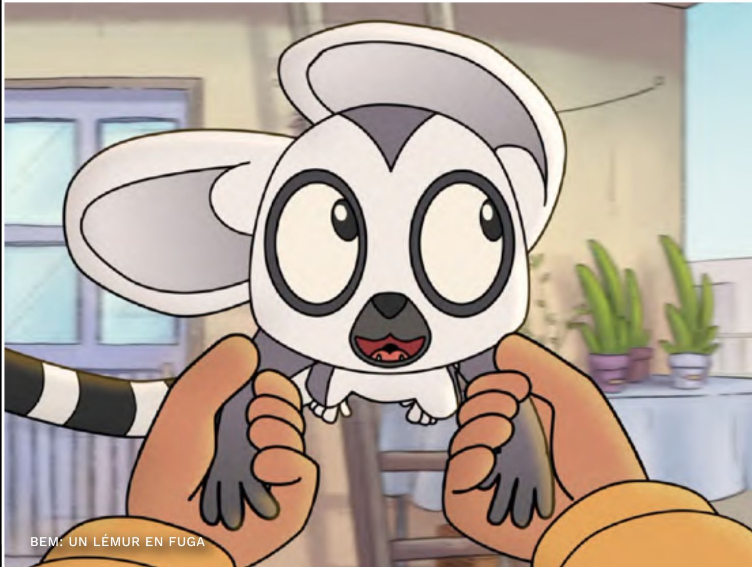
BEM: UN LÉMUR EN FUGA