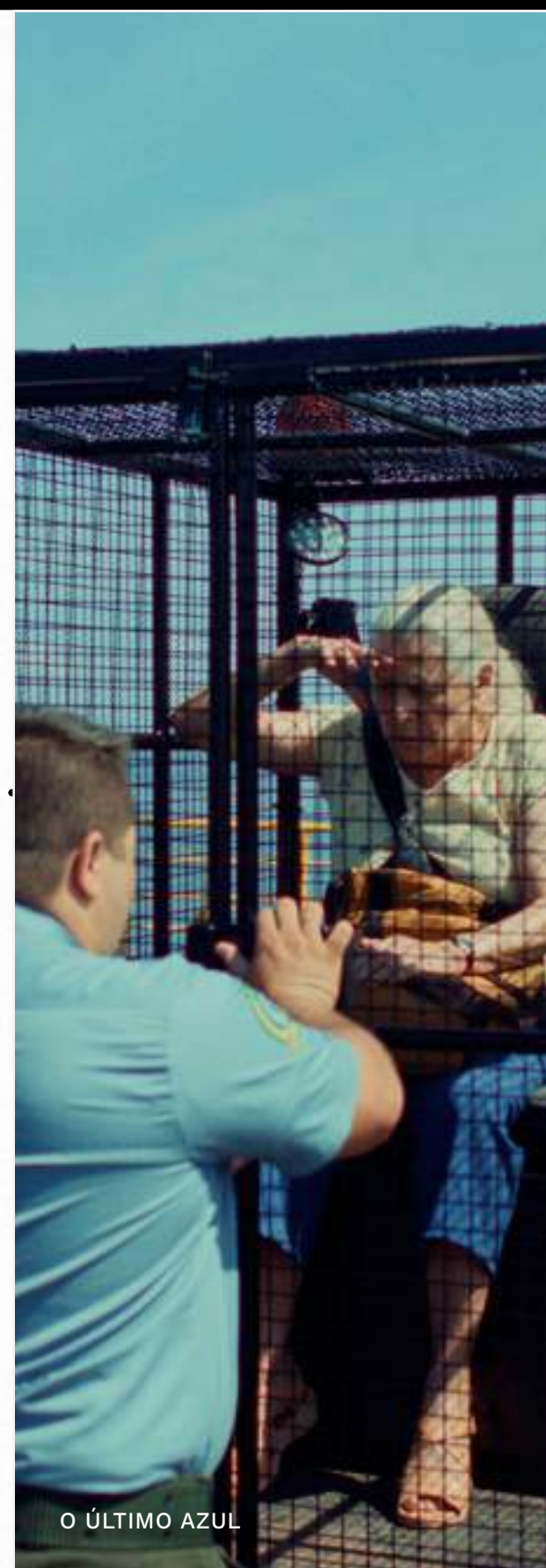
O ÚLTIMO AZUL