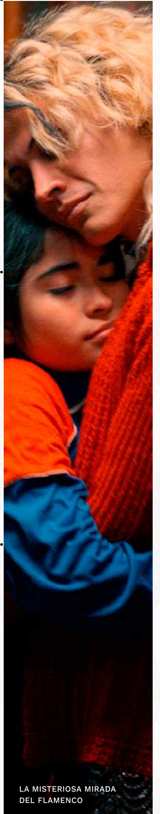
LA MISTERIOSA MIRADA DEL FLAMENCO

CLASIFICACIONES | AA: Comprensible para niños menores de 7 años | A: Todo público | B: Adolescentes de 12 años en adelante B15: No recomendada para menores de 15 años | C: Adultos de 18 años en adelante | D: Película para adultos