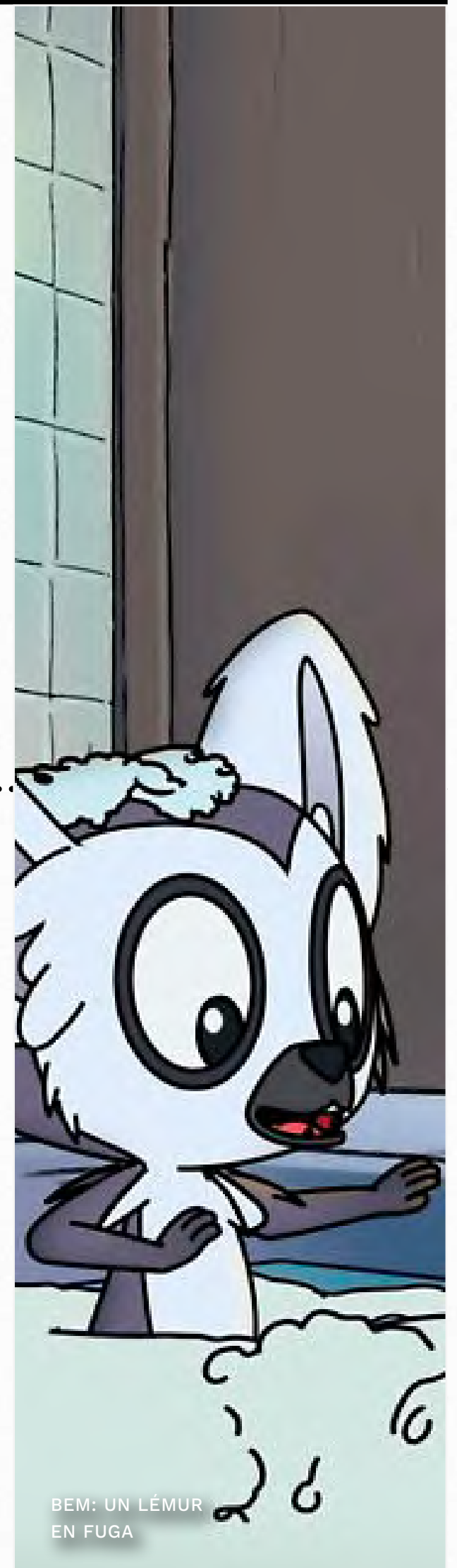
BEM: UN LÉMUR EN FUGA